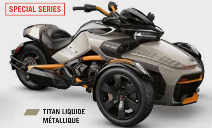
TITAN LIQUIDE MÉTALLIQUE