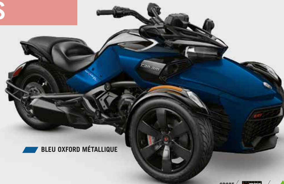
BLEU OXFORD MÉTALLIQUE