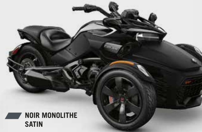
NOIR MONOLITHE SATIN